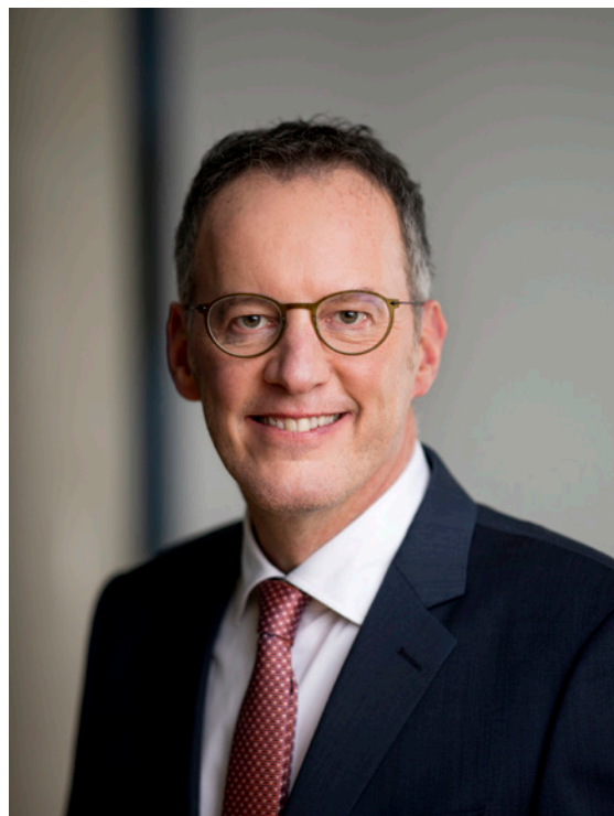
Michael Ebling Minister des Innern und für Sport des Landes Rheinland-Pfalz

Allen, die zum Gelingen der Koblenzer Meisterschaften beitragen, möchte ich ausdrücklich danken. Dem Rheinhessischen Turnerbund, dem Turnverband Mittelrhein sowie dem Pfälzer Turnerbund und seinen Mitgliedern wünsche ich eine gelungene Veranstaltung mit über 700 Athletinnen und Athleten. Allen Gästen wünsche ich eine schöne Zeit in der Stadt am Deutschen Eck und spannende Wettkämpfe bei den Meisterschaften.